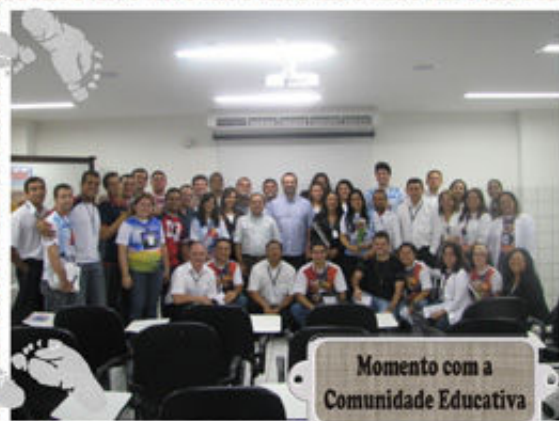
Momento com a Comunidade Educativa