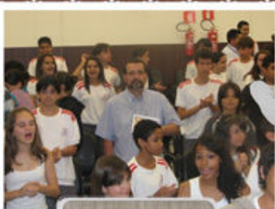
Momento com os alunos